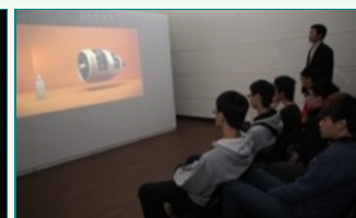
圖說：亞洲大學師生透過奧地利電子藝術節國際動畫影展，開拓國際視野。