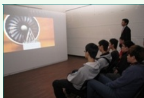
圖說：奧地利電子藝術節國際動畫影展66部影片，連續播放要7個小時。

2008年由台灣數位媒體設計學會 (TADMD) 所創設的台灣數位優勢創意設計競賽，作品分動畫組、影片組及數位平面組，每年吸引全國喜愛數位創作者踴躍參賽，今年以愛 (i) 的四次方為主題，由愛 (i) 出發，以堅強與愛心交織，透過數位媒體創作競賽表達出對社會單親家庭及弱勢族群等關懷。